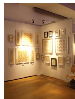
Favorite No.1 ‘I like simple one’ ‘one leaf <math>\angle 45</math>, It's me!’ ‘I like silver’