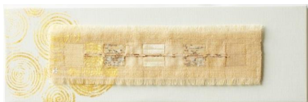
Favorite No.3 ‘Center line’ ‘vertical and horizontal balance’

■ There was no difference below; according to each personality.